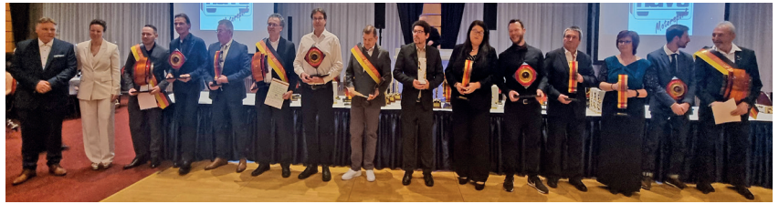
So sahen alle Ehrungen aus. Strahlende Gesichter auf der vollen Bühne.

Besonders hervorzuheben ist zudem, dass jeder einzelne Meister neben seiner Trophäe einen zusätzlichen, hochwertigen Preis erhielt. In der Disziplin Rallye wurden die Meister mit einem Preisgeld von 300 Euro ausgezeichnet, während in allen anderen Sparten Gutscheine für den DAM Sportfahrerausweis sowie für die Einschreibung in die Meisterschaft 2026 überreicht wurden. Diese Form der Anerkennung machte eindrucksvoll deutlich, welchen Stellenwert sportliche Spitzen-