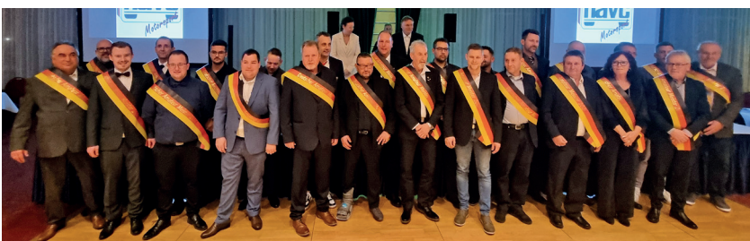
Die Meister beim Schaulaufen.

Am Ende bleibt eine Bitte von der Sportabteilung. Es waren am Ende der Ehrungen ca. 20 Pokale übrig, die für Teilnehmer vorgesehen waren, die am Abend der Feier dann nicht vor Ort waren. Deshalb jetzt schon mal die Bitte für die kommenden Jahre euch rechtzeitig abzumelden wenn Ihr nicht zur Meisterehrung kommen wollt.