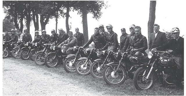
Bei den DKW-Clubs überwogen damals noch die Motorräder.