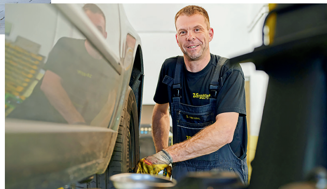
Der saisonale Reifenwechsel wird in Fachbetrieb vor Ort schnell und professionell erledigt.