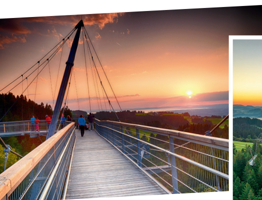
Wenn Spätsommer und Herbst zur magischen Jahreszeit werden: Der Sonnenuntergang zeigt sich vom Baumwipfelpfad im Skywalk Allgäu von seiner schönsten Seite.