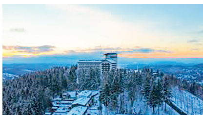
In weißem Kleid wird sich uns wohl das Ringberghotel im Dezember zur Meisterfeier zeigen.