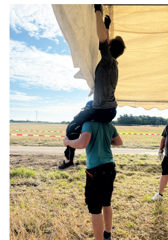
Zwei stellvertretend für alle Helfer vom ASC Rheingau