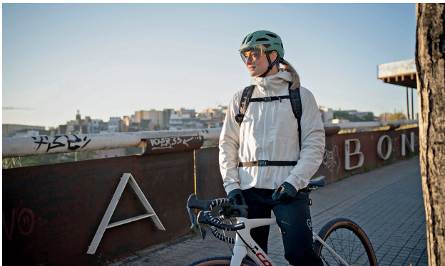
Sicher unterwegs: Ein gut sitzender und komfortabler Helm sorgt auf allen Touren für unbeschwerteren Spaß.

Die Zahlen sprechen eine deutliche Sprache: Bei rund 25 Prozent aller Fahrradunfälle ist auch der Kopf betroffen, und bei mehr als der Hälfte aller tödlichen Fahrradunfälle sind Kopfverletzungen die Ursache. Höchste Zeit, die eigene Sicherheit – und Gesundheit – wichtiger zu nehmen.