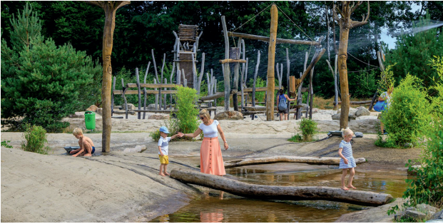
Der Spielplatz im Germanenland des Ferien- und Erlebnisparks am Alfsee ist für kleine Kinder ein großes Abenteuer.