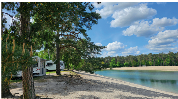
Das Südsee-Camp in der Lüneburger Heide macht mit dem weißen Strand am Badesee seinem Namen alle Ehre.