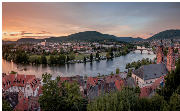
Die unterfränkischen Orte Miltenberg, Bürgstadt und Kleinheubach sind die „Drei am Main“. Oberhalb von Miltenberg findet auf der historischen Mildenburg der Kultursommer im Rahmen des Fachwerksommers 2025 statt.

Einbeck (Niedersachsen): Oldtimertage vom 4. bis zum 6. Juli. Das Highlight ist die PS.Speicher-Rallye am 5. Juli, bei der wieder zahlreiche Fahrzeuge an den Start gehen. Die historischen Schmuckstücke können dann am Sonntag, 06. Juli, beim Oldtimer-Corso durch die Stadt auch aus der Nähe bewundert werden.