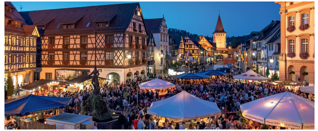
Immer am dritten Septemberwochenende wird das Gengenbacher Wein- und Stadtfest in der historischen Altstadt gefeiert – mit exzellenten Weinen, stimmungsvoller Musik und vielen Leckereien.

Oberlausitztag in Ebersbach-Neugersdorf (Sachsen) am 21. August. Bedeutendstes Fest der Region rund um die Spreequellen mit altem Brauchtum, Mundart, Musik, Trachten und Kulinarik.