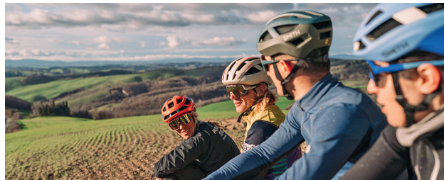
Wer viel mit dem Fahrrad auf Tour ist, sollte sich unbedingt mit einem qualitativ hochwertigen Helm ausstatten.