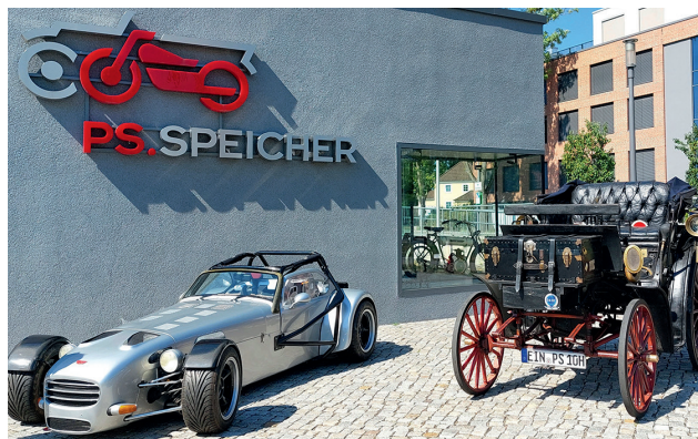
Bei den Oldtimertagen in Einbeck vom 4. bis zum 6. Juli können wieder zahlreiche „Schätzchen“ bewundert werden.

Sommerliche Musiktage Hitzacker (Niedersachsen) vom 26. Juli bis zum 3. August: Die Musiktage sind Deutschlands ältestes Kammermusikfestival und zugleich eines der innovativsten. Jeden Sommer verwandeln sie die malerische Fachwerk-Stadt Hitzacker an der Elbe zu einem Brennpunkt internationaler Musikkultur.