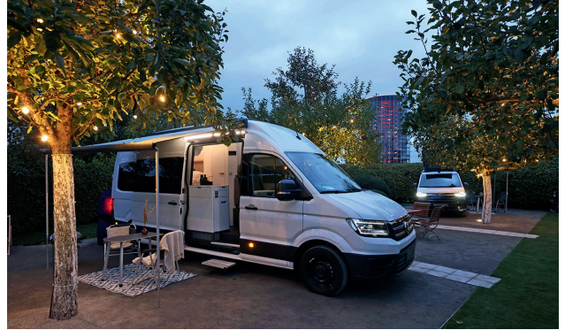
Der California Garden ist ein neues Angebot in der Autostadt Wolfsburg.

In Wolfsburg wird Camping zum Luxusurlaub: Zwischen den futuristischen Glastürmen der Autostadt übernachten Gäste hinter lauschigen Hecken entweder in zwei VW-California mit kompletter Camping-Ausstattung sowie Zugang zum Spa, Pool und Fitnessbereich des 5-Sterne-Hotels The Ritz-Carlton. Oder im eigenen Bulli. Auf Wunsch können die Annehmlichkeiten des Hotels dazu gebucht werden. Ein Besuch in der Autostadt gehört immer dazu.