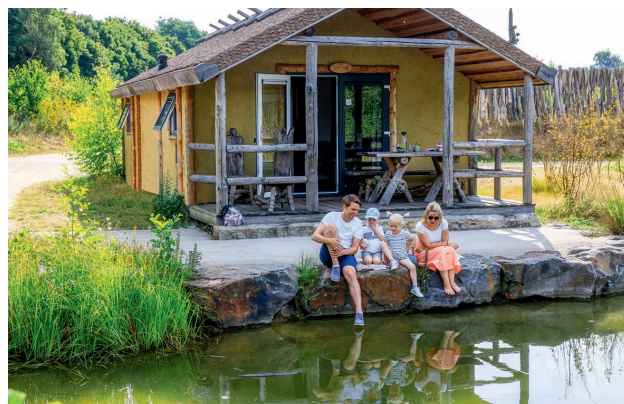
Am Alfsee können die Urlauber urige Chalets mieten, die einem germanischen Dorf von vor 2.000 Jahren nachempfunden sind.

Zwischen Wäldern und Wiesen, Heidschnucken und Heideblüte tut sich eine exotische Welt auf: Zum Südsee-Camp bei Soltau gehören ein Badesee mit weißem Sandstrand, eine Poolandschaft unter Palmen und ein tropisches Badeparadies mit Sauna. Während die Eltern sich entspannen, klettern die Kinder im Hochseilgarten, besuchen die Ponys im Reiterhof, lernen Bogenschießen oder toben sich auf der Skaterbahn aus. Für Camper mit Caravan, Zelt oder Wohnmobil, Kindern und Hunden gibt es verschiedene Bereiche, dazu Ferienhäuser und Restaurants. Wem das noch nicht reicht, der kann Attraktionen wie den Heidepark Soltau oder den Serengeti-Park besuchen. Unter www.reiseland-niedersachsen.de/camping sind dieser und andere Campingplätze und Ausflugstipps zu finden.