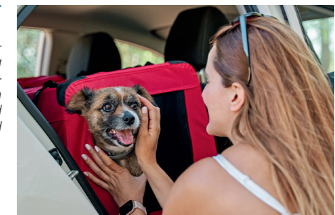
Mit dem vierbeinigen Liebling auf Reisen: Regelmäßige Pausen für Bewegung und fürs Trinken sind ein Muss.

fehlen. Gut geeignet sind Trinkflaschen mit integriertem Napf oder faltbare Wasserbehälter, die wenig Platz im Gepäck benötigen. Unter www.futterhaus.de etwa finden sich ausführliche Tipps für das sichere und gesunde Reisen mit Haustier sowie Adressen von bundesweiten Fachhandlungen für eine individuelle Beratung.