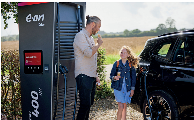
Flexibel das E-Auto aufladen: Vor allem Familien wünschen sich Lösungen, die sich nahtlos in den Alltag integrieren.

(DJD). Entspannt über den Wochenmarkt bummeln, mit der ganzen Familie ins Kino gehen oder das Schwimmbad besuchen – und währenddessen bequem das E-Auto mit Energie versorgen: Das sogenannte Destination Charging steht hoch im Kurs. Sieben von zehn Besitzern von Elektroautos erwarten heute Ladepunkte beispielsweise an Einkaufszentren oder Baumärkten, mehr als die Hälfte an Freizeiteinrichtungen wie Zoo und Vergnügungspark. Das hat eine aktuelle Umfrage von E.ON mit mehr als 1.000 Teilnehmenden ergeben. Vorteil: An diesen Orten steht das Auto ohnehin für längere Zeit still, sodass sich das Laden nebenbei erledigen lässt.