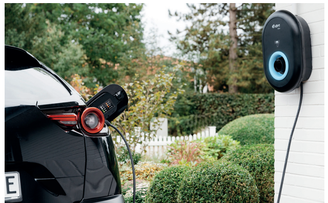
Bonus inklusive: Innovative Stromtarife für das E-Auto stoßen auf großes Interesse.

Die Mehrheit der E-Autofahrer lädt allerdings weiterhin daheim. 71 Prozent verfügen über eine Lademöglichkeit auf dem eigenen Grundstück oder in der Garage. Gerade hier interessieren sich viele für innovative Stromtarife. Besonders gefragt sind Modelle mit festem Preis pro geladener Kilowattstunde und zusätzlichem Bonus für nächtliches Laden – 37 Prozent würden solch einen Tarif bevorzugen. Auf diese Bedürfnisse reagiert etwa E.ON mit Angeboten wie dem Tarif „Home & Drive“. Dabei übernimmt der Energieversorger das Lade-Management: Das Auto wird automatisch zu den günstigsten Zeiten in der Nacht geladen – zu einem festen Preis pro Kilowattstunde und ganz ohne Risiko schwankender Strompreise. Für dieses flexible Lademanagement profitieren Kunden im Gegenzug von einem Nachtladebonus von bis zu 240 Euro jährlich.