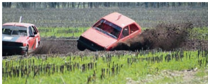
► Malin Buck(680) legt den Polo auf das Dach

Das hätten die Beiden auch ausknobeln können, da sie beide auf einem Auto gefahren sind.